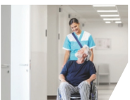
logistics & care